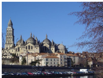
Périgueux – Cathédrale St Front