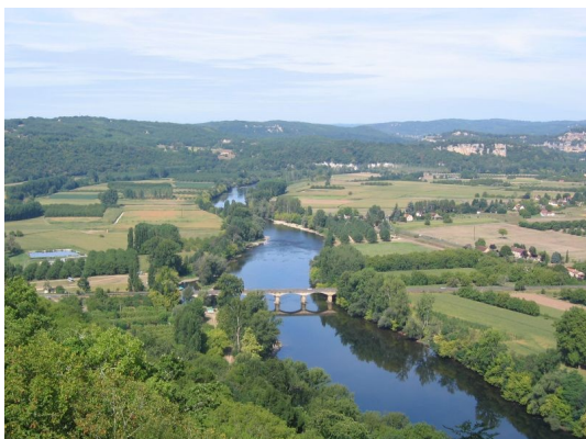
La Dordogne vue de Domme

Pour ceux que la distance rebute ou qui manquent de temps, nous proposons quatre options courtes qui permettent de ramener la distance totale jusqu'à 450 km environ sans toutefois dénaturer la randonnée.